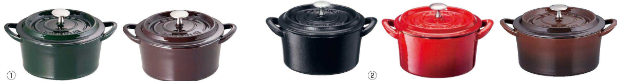
① ボン・ボネール ココット〈ABV-B8〉