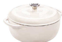
オイスターホワイト