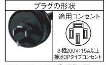
※イラストはコンセント受け電線の形と配置を示したものです。