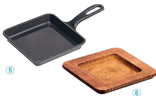
5 ロッジ スクエア スキレット L5WS3 〈GLT-31〉 9-0070-0501 ¥2,500 内132×深さ18 0.8kg