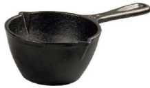
1 ロッジ メルティングポット LMP3 〈AML-53〉 9-0070-0101 ¥3,300 内127×深さ65 底径74 0.8kg ●チーズ、バター、シロップを加熱するのに最適です。