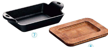
7 ロッジ レクタングル ミニサーバー HMSRC 〈GLT-23〉 9-0070-0701 ¥3,800 内140×100 深さ28 0.7kg