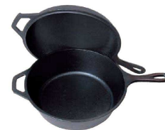
9 ロッジ コンボクッカー LCC3 〈GLT-07〉 9-0070-0901 ¥12,000 内径 深さ kg 底径 鍋 255 80 2.9 180 蓋 245 40 2.6 195 セット: φ267×H120 質量: 5.5kg ●蓋部のスキレットが深型となり、よりクッキングの幅が広がりました。スキレットと片手鍋が一体になった万能調理器です。