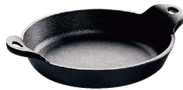
2 ロッジ ラウンド ミニサーバー HMSRD 〈GLT-26〉 9-0070-0201 ¥4,800 内155×深さ26 0.8kg ※木台はP.69⑤スキレット用木台U3RPがご使用できます。