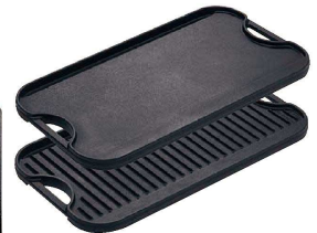
13 ロッジ LPGI3 〈GLT-21〉 9-0070-1301 ¥13,800 間口 奥行 高さ kg 508×265×25 6.4