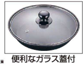
便利なガラス蓋付

14~16 材質:鍋/アルミニウム合金 蓋/陶器 表面加工:内側/フッ素樹脂加工 外側/焼付塗装 ※赤のみ底面溶射構造です。