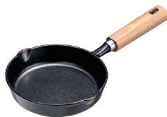
17 鉄鋳物 スキレット木柄 (ASK-91)

ハンバーグやステーキ、餃子にアヒージョetc...器としてテーブルにサーブすれば素材の旨みも逃しません!