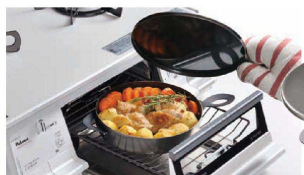
12 鉄 グリルダッチオープン LS1507 (PGL-D1)

●オープンでココットが楽しめる小さい鉄鍋です。 ●たまご料理からデザートまでレシピの数は無限大です。