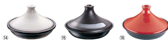
ブローディア IH タジン鍋 (ガラス蓋付)