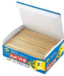
② 竹製うなぎ串 (箱入1kg) 入販 (DKS-15)