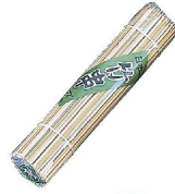
③ 竹製丸串 (200本入) 入販 (DKS-03)