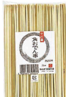
⑫ 竹製 十八番角おでん串 入販 (DOD-01)