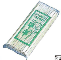
⑤ 竹製平串 (100本入) 入販 (DKS-16)