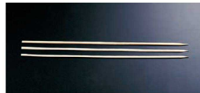
⑮ 竹製 半月串 (200本入) (DHV-19) 目 入販 9-0780-1701 15 ¥720 9-0780-1702 18 ¥800 幅:4mm