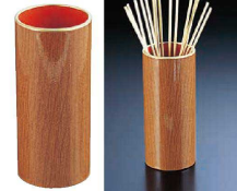
⑲ UK18-8 串入れ (DKS-31) 9-0780-2101 ¥3,580 φ40×H100 (ベースφ80)