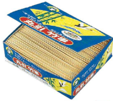
① 竹製丸串 (箱入1kg) 入販 (DKS-02)