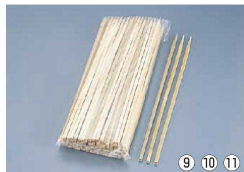
⑨ 竹製 角串ロング 300mm 2541 (200本入) 入販 (XOI-27) 9-0780-0901 ¥2,700 巾4×300