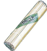
④ 竹製角串 (200本入) 入販 (DKS-04)