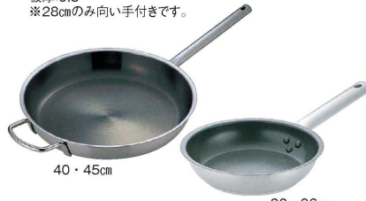
5 Murano (ムラノ) インダクションテフロンセレクト18-8 フライパン (AHL-V7)