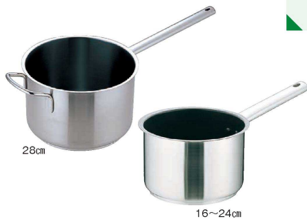
1 Murano (ムラノ) インダクションテフロンセレクト18-8片手深型鍋 (蓋無) (AKT-D2)

片手鍋は握りやすく疲れにくいデザインハンドルを採用。忙しい厨房内でもしっかりとホールドできるので安心です。