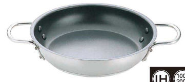
6 Murano (ムラノ) インダクションテフロンセレクト18-8 オムレツパン (AOM-06)