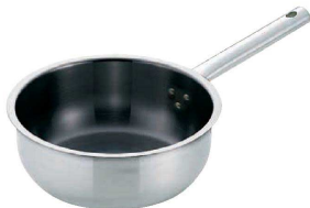
4 Murano (ムラノ) インダクションテフロンセレクト18-8 ソテーパン (AST-12)