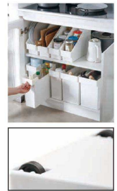
キャスター2個付で出し入れも楽々

〈DST-12〉 目 9-0814-0401 ¥600 350×110×H265 ③④ 材質:ポリプロピレン ●調味料からトレー、フライパンまで様々なキッチン用品をすっきりと収納できます。