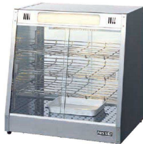
12 電気ホットショーケースNH-703 〈EHT-46〉 9-0827-1201 ¥190,000 600×450×H615