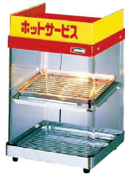
1 ホットショーケースED-1 〈EHT-06〉 9-0827-0101 ¥70,000 380×300×H570 電源:単相100V・240W 背面:オープン 付属品:ケーキバット14インチ2枚 網10枚取2枚