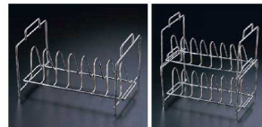
6 18-8 スタッキング式 網焼きスタンド NJ10032 〈ETI-04〉 9-0827-0601 ¥3,200 240×160×H145 ●効率よく熱が伝わるのでムラなく保温できます。 ●スタッキング式なので2段・3段と積み重ねる事ができスペースを有効活用できます。