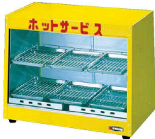
5 ホットショーケースED-8 (加湿機能内蔵) 〈EHT-11〉 9-0827-0501 ¥145,000 600×350×H470 電源:単相100V・390W 温度調節:30~85℃(サーモ可変式) 扉開閉方式:後面スライドガラス 付属品:ケーキバット10インチ6枚 網21枚取6枚