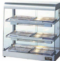
10 電気ホットショーケースNH-606E 〈EHT-59〉 9-0827-1001 ¥314,000 600×300×H615