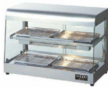
9 電気ホットショーケースNH-305E 〈EHT-58〉 9-0827-0901 ¥256,000 600×300×H415