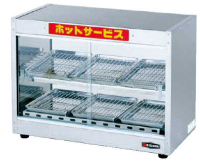
4 ホットショーケースED-5 (加湿機能内蔵) 〈EHT-10〉 9-0827-0401 ¥102,000 600×300×H460 電源:単相100V・440W 温度調節:30~85℃(サーモ可変式) 扉開閉方式:両面スライドガラス 付属品:ケーキバット10インチ6枚 網21枚取6枚