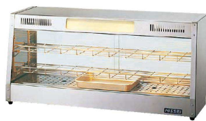
13 電気ホットショーケースNH-403 〈EHT-55〉 9-0827-1301 ¥195,000 900×300×H415