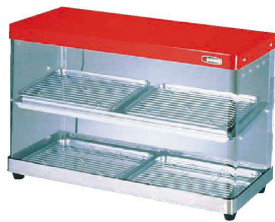
2 ホットショーケースED-2 〈EHT-07〉 9-0827-0201 ¥127,000 760×300×H480 電源:単相100V・485W 背面:オープン 付属品:ケーキバット14インチ4枚 網10枚取4枚