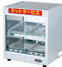
3 ホットショーケースED-6 (加湿機能内蔵) 〈EHT-09〉 9-0827-0301 ¥92,000 400×300×H460 電源:単相100V・430W 温度調節:30~85℃(サーモ可変式) 扉開閉方式:両面スライドガラス 付属品:ケーキバット10インチ4枚 網21枚取4枚