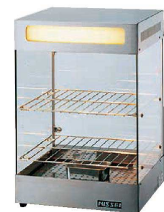
14 電気ホットショーケースNH-550T 〈EHT-22〉 9-0827-1401 ¥185,000 400×400×H600