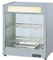
8 電気ホットショーケースNH-204 〈EHT-57〉 9-0827-0801 ¥127,000 300×400×H460

お店のメニュー、規模に合わせて豊富な機種の中からお選びください。オールステンレスで美しく衛生的。しかも頑丈です。