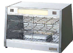
11 電気ホットショーケースNH-502 〈EHT-44〉 9-0827-1101 ¥128,000 600×450×H415