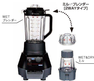
4 マルチシェフ ミルブレンダー 小ミルカップ付 MC-121DMBL (FBL-B4) 9-0934-0401 ¥48,000