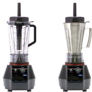
強化樹脂ボトル ステンレスボトル 2 マルチシェフ ブレンダー MC-2000BLR (FBL-85) 9-0934-0201 ¥142,000 4 マルチシェフ ブレンダー MC-2000BLSSR (FBL-86) 9-0934-0301 ¥150,000