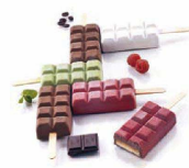
チョコスティック