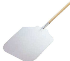
⑦ 木柄 アルミ ピザピール (WPZ-12)