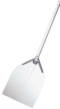
② AM アルミピザピール ミディアム (GPZ-31)