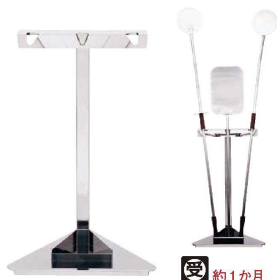
⑨ UK 18-8 ピザピールラック (GPZ-44) 9-0964-0901 ¥69,900 550×400×H850 5.9kg 収納本数:3本