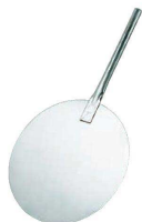
⑤ UK 18-8 ピザピール 丸 短柄 (GPZ-29)