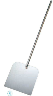
④ デバイヤー 18-10 ピザピール角型 3293-31 (WPZ-16) ¥20,000 310×310×全長1,265