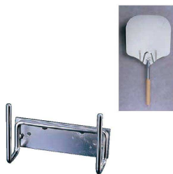
⑩ AM ピザピールラック WPH45153 (GPZ-16) 9-0964-1001 ¥6,600 115×45(27)×H80 ● クロームメッキ ● 壁面にラックを取り付けて使用します。