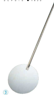
③ デバイヤー 18-10 ピザピール 3290-31 (WPZ-14) ¥18,000 φ310×全長1,255