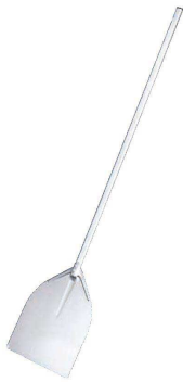
① AM アルミピザピール スモール (GPZ-30)