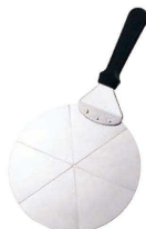
⑥ UK アルミピザサーバー (GPZ-43)