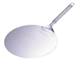
⑧ シェフランド ビッグピザサーバー (GBT-03)