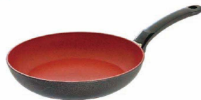
⑨ フィスラー センサーレッドフライパン (AFL-14)