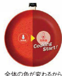
全体の色が変わるから誰でもわかる!