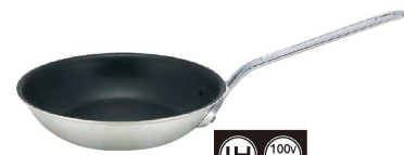
⑦ アルミ プロマイスター IHセラミックCTフライパン (AHL-S3)