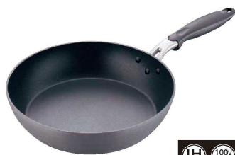
① ロック&ロック 鍛造硬質アルマイトIHフライパン (AFL-07)