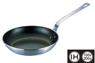
⑧ 18-10ロイヤル FCフライパン XFD (AHL-M2)