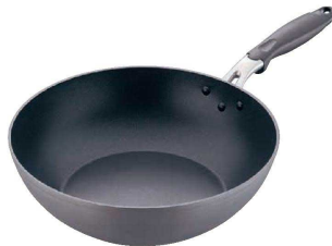
② ロック&ロック 鍛造硬質アルマイトIHいため鍋 (AIT-31)