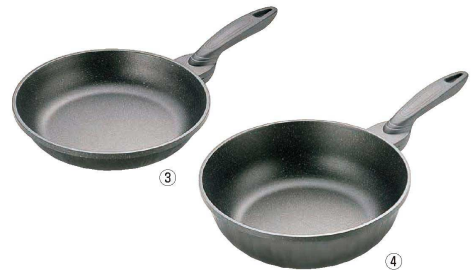
③ IHテフロンマーブルコート フライパン (AHL-W5)