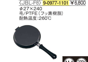
⑯ お好み焼き・ホットケーキパン

375×160 底面サイズ: 118×108 焼面サイズ: 内144×134 材質: 本体/アルミニウム合金 (表面/フッ素樹脂塗膜加工) はり底/ステンレス鋼 ハンドル/フェノール樹脂 ●着脱式で洗いやすく、小さなフライパンとしてもご使用 いただけます。