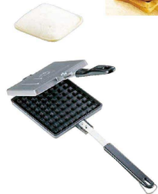
⑦ ワッフルトースター

141×354×H50 材質: 本体/アルミニウム合金 ハンドル/18-8ステンレス、フェノール樹脂 質量: 570g ●イワタニカセット専用ホットサンドグリルです。 ●セラレート式でミニフライパンとしても使えます。 ●内側にフッ素樹脂加工が施されているので、 使用後のお手入れが簡単です。