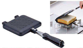
② あっほかダイニング ホットサンドパン AM-9867

240×236×H105 プレートサイズ: 内216×129 電源: 100V 消費電力: 650W 材質: 本体/フェノール樹脂 プレート/アルミダイキャスト合金(フッ素樹脂加工) おにぎり型/ポリプロピレン コード長さ: 1.4m 質量: 約2.21kg セット内容: ホットサンドプレート ワッフルプレート 焼きおにぎりプレート おにぎり型 ●3種類のプレートでホットサンド・ワッフル・ 焼きおにぎりを作れます。