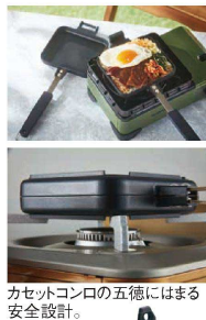
⑥ イワタニ ホットサンドグリル CB-P-HSG

114×114×H33 出来上がり寸法: 96×96 材質: ポリプロピレン (耐熱120℃) ●サンドパンが簡単に作れます。