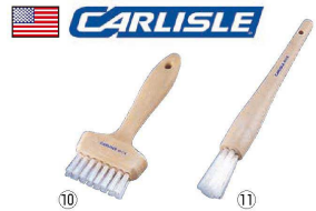
⑩ カーライル 40114 ワッフルブラシ

223×128×H33 底面サイズ: 90×95×2枚 材質: 本体/アルミダイキャスト (内面/フッ素樹脂加工 外面/耐熱焼付塗装) はり底/ステンレス鋼 ハンドル/フェノール樹脂