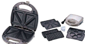
① ラノー 着脱式ホットサンド(3枚組) MJ-0844