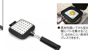
⑮ サンドdeグルメ KS-2887

345×150 底面サイズ: 100×90 ●本体/アルミニウム合金 (内面/フッ素樹脂塗膜加工) はり底/ステンレス ハンドル/フェノール樹脂