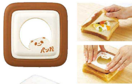
⑤ サンドでパンだ RE-182

387×200×H45 材質: 本体/アルミニウム合金 材質: 本体/アルミニウム合金 (内外面/フッ素樹脂加工 外面/焼付塗装) ハンドル/フェノール樹脂