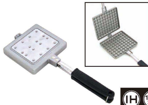
⑧ スナック ワッフル KS-2936

360×127 ●アルミテフロン加工 ●市販のケーキミックスや自家製の生 地で、とっても美味しいワッフルがご 家庭で手軽に作れます。