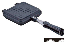
③ あっほかダイニング IHホットサンドパン AM-9868

②③ ●耳を切り落とさずに、食パン がそのまゝ入るサイズです。 ●本体は分解ができるので お手入れが簡単です。