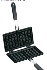
⑨ MBベルジャン ワッフルメーカー No.1590

338×138 底面サイズ: 100×90 ●本体/アルミニウム合金 (内面/フッ素樹脂塗膜加工) はり底/ステンレス ハンドル/フェノール樹脂