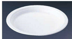
⑬ 業務用モールドプレート (50枚入) (GMC-06) mm 9-0989-1301 BP-01 15 φ150×H15 ¥ 760 9-0989-1302 BP-02 18 φ180×H20 ¥1,160 9-0989-1303 BP-03 23 φ230×H20 ¥1,800 9-0989-1304 BP-04 26 φ260×H20 ¥2,140

砂糖の製造過程でできるサトウキビ繊維をモールド加工することにより、丈夫で固く抜群の強度と耐熱性を確保。廃棄の際にも有毒ガスを発生しない自然にやさしい器です。電子レンジでの使用が可能です。