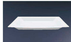
⑳ 発泡舟皿 (100枚入) (GZL-02) 9-0989-2001 ¥1,250 199×107×H18 材質:発泡スチレンシート