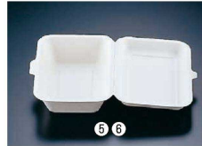
⑤ パルプモールドパック MP-1 (大) (50枚入) (GMC-17) 9-0989-0501 ¥2,900 184×129×H44 16