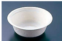
⑨ パルプモールドどんぶり (50枚入) (GMC-01) 9-0989-0901 中 MD-3 φ155×H53 500cc. ¥2,000 9-0989-0902 小 MD-7 φ115×H43 225cc. ¥1,000