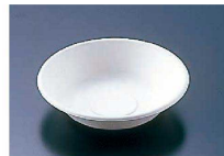
⑩ パルプモールド椀 MIM031 (50枚入) (GMC-05) 9-0989-1001 ¥1,340 φ160×H36 容量:約400cc.