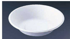
⑮ 業務用モールドポウル (50枚入) (GMC-08) 9-0989-1501 BP-06 15cm φ160×H35 440cc. ¥1,120 9-0989-1502 BP-07 18cm φ190×H41 760cc. ¥1,640