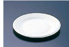
⑦ パルプモールドプレート (50枚入) (GMC-03)

9-0989-0701 15cm MM-8 φ155×H12 ¥1,000 9-0989-0702 18cm MM-7 φ184×H16 ¥1,660 9-0989-0703 21cm MM-6 φ210×H18 ¥1,800