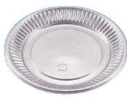
⑰ ブラ DX 丸皿 (100枚入) (GPL-15) 9-0989-1701 K-1 φ155×H16 ¥2,340 9-0989-1702 K-2 φ180×H18 ¥4,000 9-0989-1703 K-3 φ215×H20 ¥4,950