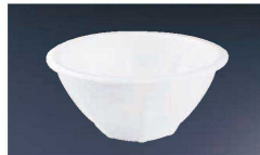
⑲ ポリスチレンどんぶり (50枚入) (GPS-01) 9-0989-1901 E-3R小 φ117×H52 240cc. ¥1,080 9-0989-1902 E-2R中 φ160×H68 650cc. ¥1,480 耐熱温度:70℃ 材質:ポリスチレン ●保温、保冷性に優れており、汁物に最適です。