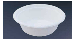
⑯ 業務用モールドどんぶり (50枚入) (GMC-19) 9-0989-1601 BP-08 14cm φ150×H55 570cc. ¥1,740 9-0989-1602 BP-09 12cm φ130×H48 350cc. ¥1,200