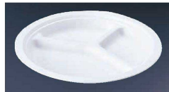
⑭ 業務用モールドプレート仕切 (50枚入) (GMC-07) 9-0989-1401 φ260×H24 ¥2,260