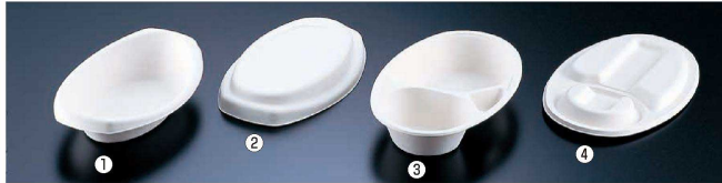
① パルプモールドカレー皿 MZ-1 (50枚入) (GMC-13) 9-0989-0101 ¥3,500 230×148×H52 12