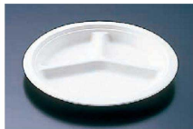
⑧ パルプモールドプレート三仕切 MM-1 (50枚入) (GMC-02) 9-0989-0801 ¥3,050 φ260×H20

9-0989-0701 15cm MM-8 φ155×H12 ¥1,000 9-0989-0702 18cm MM-7 φ184×H16 ¥1,660 9-0989-0703 21cm MM-6 φ210×H18 ¥1,800