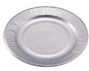
⑱ 紙皿シルバープレート (100枚入) (GPL-16) 号 高さ 9-0989-1801 4 φ105×8 ¥2,100 9-0989-1802 5 φ130×10 ¥2,700 9-0989-1803 6 φ150×12 ¥3,300 9-0989-1804 7 φ180×12 ¥4,400 9-0989-1805 8 φ200×16 ¥6,100 9-0989-1806 9 φ230×16 ¥7,400