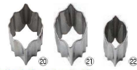
18-8 抜型 柵 (ひいらぎ)