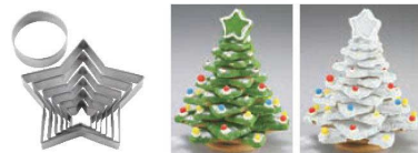
⑳ 18-0 抜型 もみの木 No.1938