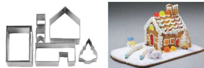
㉔ 18-0 抜型 クッキーハウス No.1939