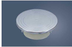
②鋳物 デコレーション 回転台