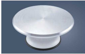
①アルミ鋳物 デコ回転台 4157