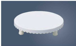
⑥PC デコレーション 回転台 小