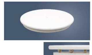
⑪人工大理石 回転台

外寸:φ310×H140 材質:本体/ABS樹脂、Uピン/18-8ステンレス ●ケーキ側面のデコレーションがきれいにできます。 ●スタンド式なのでケーキを置く位置が高く、デコレーションしやすいです。