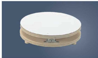
⑦木製 白デコラ 回転台