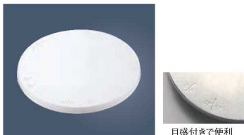
⑨PC トラクタ クールスタンド (回転台)