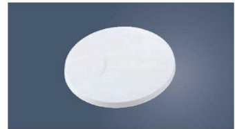
⑧PC クールスタンド (回転台) 切