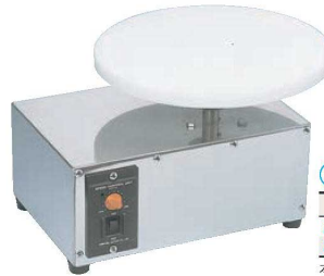
⑤電動 ジュラコン 回転台