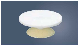
④ジュラコン 回転台