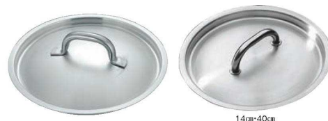
⑧マトファー／ブウジャ 鍋蓋