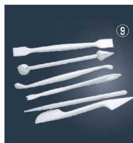
マジパン細工棒 6本セット