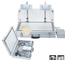
②アメランプ 2灯式 312500 (トランクタイプ)