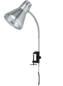
③テーブル固定式 アメランプ 375W

外寸:625×425×H110(作業台585×385) 重量:9.5kg 電源:単相100V/500W(×2) セット内容 トランク .....1 ランプ .....100V 500W×2 コントロールBOX .....1 風防 .....1 シリコンマット .....1