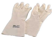
④マトファーフューガーグローブ