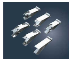
⑪18-8 マジパンニッパー (6本入) No510