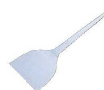
⑮T 18-0 ヘガシ金