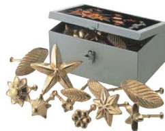
⑫マトファー マジフラワー 17ヶセット 779497 (ブロンズ製)