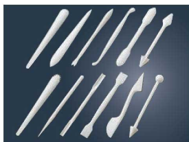
⑧マトファー マジパンスティック 12本セット 80381