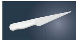
⑥テルモハウザー マジパンナイフ 38273

全長:425mm 材質:本体/ゴム ノズル/アルミ ①大量の空気を流入させることができます。 ②少量の空気を流入させ、膨らませ方を微調節することができます。