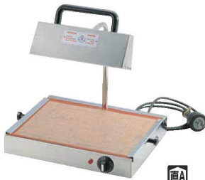
①マトファー アメランプ 740473