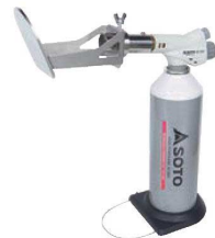
③ キャラメライザー KC-810CL