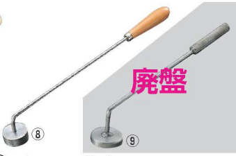
⑧ マトファー 焼ごて ボルカ 80471