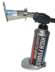
② キャラメライザー SCT-530CZ