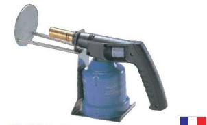
① デバイヤー キャラメライザー 3052-15