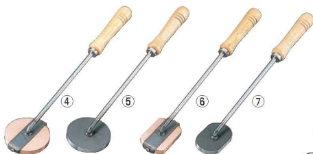
④ 銅 木柄 丸 キャラメライザー 8cm

Check! ●キャラメライザー・焼ごては、ケーキの上にくらべた砂糖をキャラメル状にするために使用します。