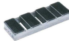
⑤遠赤セラミック加工S ミニ食パン型 (フタ無)