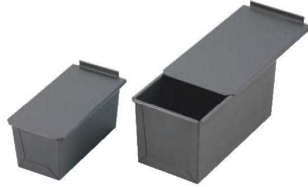
①遠赤セラミック加工S 食パン型 (フタ付)

遠赤セラミック加工 材質:アルスター(アルミメッキ鋼板) ●遠赤外線放射なので焼きムラがなく中はふっくらしっとり焼け、非常に効率が良いです。