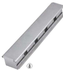
アルタイト ミニ食パンケース (蓋付)