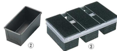
②遠赤セラミック加工S ワンローフ