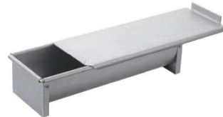
②プロベーカー 半円焼型 切