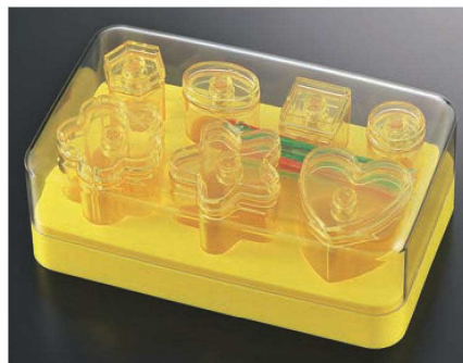
⑦ラ・カナッペメーカー保存容器付 No.2268 切