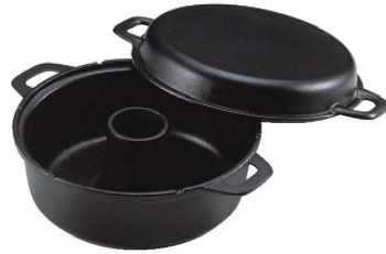
①南部 鉄イモノ パン焼器 切