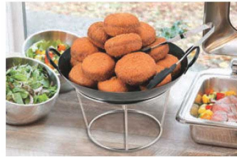
中華鋼はP169・P170をご参照ください。