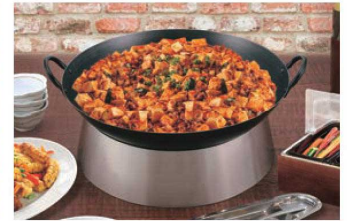
中華鋼はP169・P170をご参照ください。

組み合わせやすいサイズ展開でスタッキングもOK カラフルな彩りは、アイキャッチ効果を高めます。