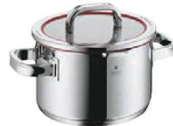
⑥WMF ファンクション4 ハイキャセロール 内径 ページコード 外径 深さ 板厚 底径 kg 商品コード 価格 16cm 4-0105-0601 2.1 178 101 5.0 148 1.33 1072900 ¥28,000 20cm 4-0105-0602 4.0 220 127 5.0 188 1.95 1072910 ¥32,000