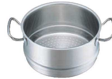
④スチーマー 83-773 内径 ページコード 外径 深さ 板厚 底径 kg 商品コード 価格 20cm 4-0105-0401 221 110 1.0 183 0.8 8592700 ¥28,000