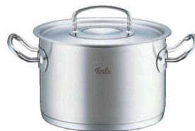
②シチューポット 84-123 内径 ページコード 外径 深さ 板厚 底径 kg 商品コード 価格 16cm 4-0105-0201 2.0 181 106 1.0 150 1.5 8591110 ¥31,000