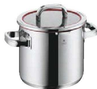
⑤WMF ファンクション4 ストックポット 内径 ページコード 外径 深さ 板厚 底径 kg 商品コード 価格 20cm 4-0105-0501 5.5 220 177 5.0 188 2.14 1072930 ¥38,000