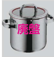
⑤WMF ファンクション4 ストックポット 内径 ページコード 外径 深さ 板厚 底径 kg 商品コード 価格 20cm 4-0105-0501 5.5 220 177 5.0 188 2.14 1072930 ¥38,000