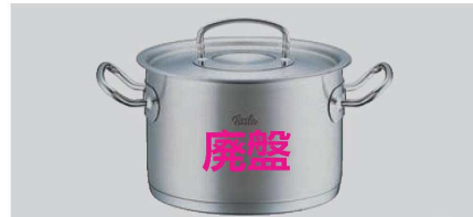
②シチューポット 84-123 内径 ページコード 外径 深さ 板厚 底径 kg 商品コード 価格 16cm 4-0105-0201 2.0 181 106 1.0 150 1.5 8591110 ¥31,000