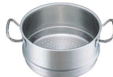
④スチーマー 83-773 内径 ページコード 外径 深さ 板厚 底径 kg 商品コード 価格 20cm 4-0105-0401 221 110 1.0 183 0.8 8592700 ¥28,000