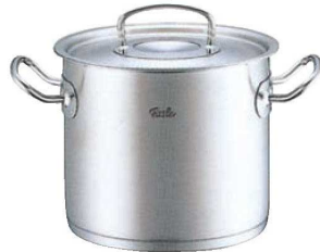
①ストックポット 84-113 内径 ページコード 外径 深さ 板厚 底径 kg 商品コード 価格 20cm 4-0105-0101 5.1 221 169 1.0 190 2.3 8591001 ¥40,000