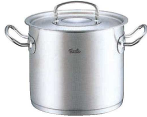
①ストックポット 84-113 内径 ページコード 外径 深さ 板厚 底径 kg 商品コード 価格 20cm 4-0105-0101 5.1 221 169 1.0 190 2.3 8591001 ¥40,000