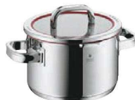
⑥WMF ファンクション4 ハイキャセロール 内径 ページコード 外径 深さ 板厚 底径 kg 商品コード 価格 16cm 4-0105-0601 2.1 178 101 5.0 148 1.33 1072900 ¥28,000 20cm 4-0105-0602 4.0 220 127 5.0 188 1.95 1072910 ¥32,000