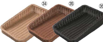
ベーカリーバスケット 斜め25型