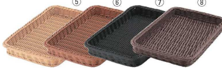
ベーカリーバスケット 36型