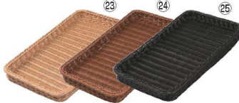
ベーカリーバスケット 薄型25型