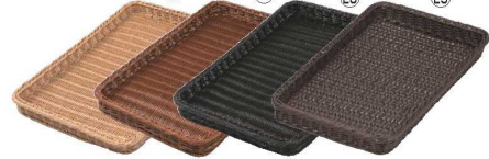
ベーカリーバスケット 薄型30型