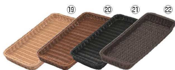
ベーカリーバスケット 薄型20型