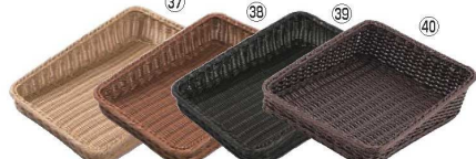
ベーカリーバスケット 斜め30型