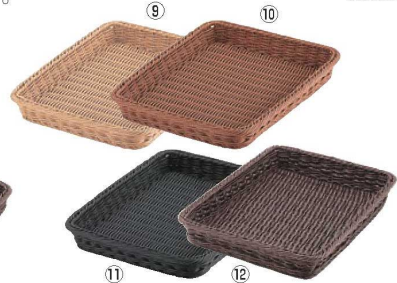
ベーカリーバスケット 40型