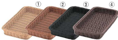
ベーカリーバスケット 32型

材質:ポリプロピレン 耐熱温度:120℃ 籐のような手編みのぬくもり、柔らかいのに丈夫なしっかり形状 生鮮、鮮魚、青果、精肉、ベーカリー等さまざまなシーンで活躍