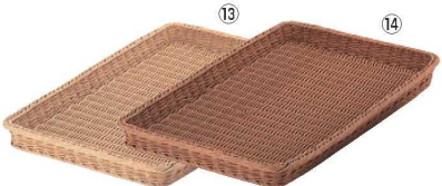
ベーカリーバスケット 60型