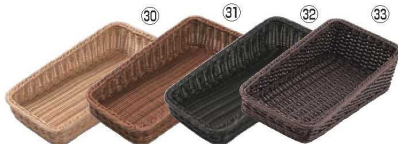
ベーカリーバスケット 斜め20型