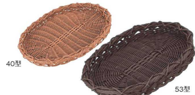
⑱ 小判型バスケット デコレートエッジ