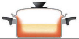
全面多層構造のビタクラフト 側面にも効率よく熱が伝導