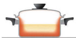
全面多層構造のビタクラフト 側面にも効率よく熱が伝導