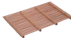
⑥籐製 スカシスノコ 茶