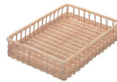
③籐製 大型パンカゴ