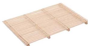
⑤籐製 スカシスノコ