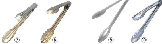
⑦EBM ステンレス 金トング 小