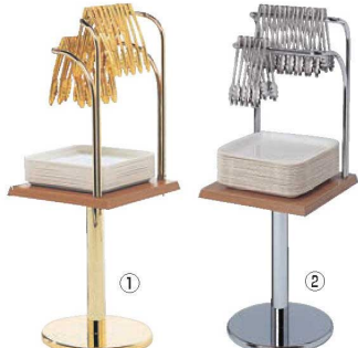
シンプルセルフスタンド