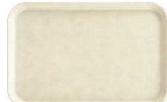
⑮ザ・セルストレー