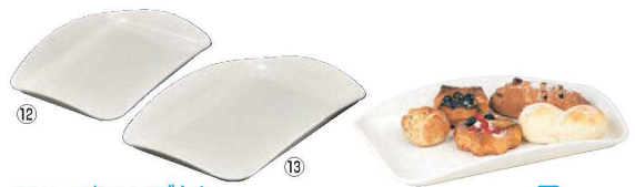
ニューウェアセルフトレイ