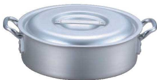
③ EBM アルミ プロシェフ 外輪鍋