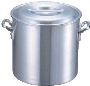
① EBM アルミ プロシェフ 寸胴鍋 (目盛付)