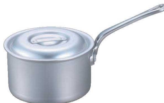
④ EBM アルミ プロシェフ 深型片手鍋 (目盛付)