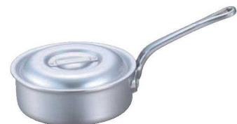
⑤ EBM アルミ プロシェフ 浅型片手鍋 (目盛付)