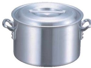
② EBM アルミ プロシェフ 半寸胴鍋 (目盛付)