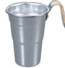
⑪アルミ 酒タンポ 藤巻