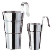
⑨モモ 18-8 酒タンポ

φ70×110×H120 重量:150g 容量:330ml 材質:本体/銅 内面/錫メッキ 柄/真鍮・藤 仕上げ/ブロンズ