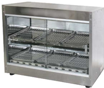
納期 値B ④TBホットショーケース TBHS-600SK 74 ページコード 商品コード 価格 4-1104-0401 0342600 ¥120,000

商品を早く効果的に蒸し上げ、蒸気を発生させながら保温しますので、中華まん等の店頭販売に最適です。