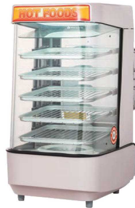
納期 値B ⑤スチームマスター MJ45AL 57