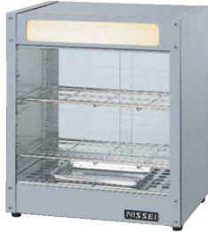
納期 値B ①ホットショーケース NH-205 77 ページコード 商品コード 価格 4-1104-0101 2955320 ¥147,000