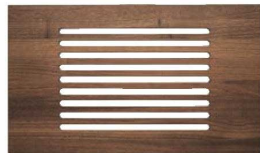
⑩ブレッドボード 1/1 ブラウン