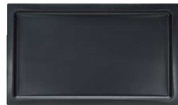
⑪木枠用ドリフトレー