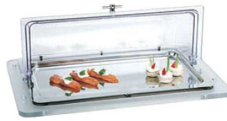
⑤アクリル コールドビュッフェ 角型

外寸:555×350×H300 材質:本体/ウォーターパン/18-8ステンレス フードリブ32BCW(2.4L)×3/ポリカーボネイト ロールカバー/ポリカーボネイト ●電気を使わずにビュッフェバー、サラダバーが作れます。電気を使わないため、リズナブルかつ故障をどの心配が少なくなります。 ●ウォーターパンにクラッシュアイスや、保冷剤(P730)を入れてご使用ください。