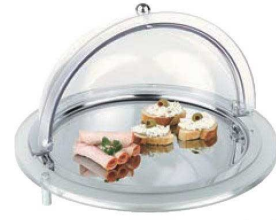
⑥アクリル コールドビュッフェ 丸型

外寸:610×380×H260 材質:カバー/ベース/アクリル プレート/ウォーターパン/18-10 ※保冷器2個付