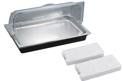
③SXアイスディスプレイセット (G/N)

外寸:370×370×H250 材質:本体/18-8ステンレス トレイ/下皿/18-8ステンレス ロールカバー/ポリカーボネイト ●付属品:アイスボックス 4-1146-0203 7493640 ¥620 1個付 ●電気を使わないアイスディスプレイセットです。 ●デザートや海鮮盛り込みに最適です。 ●付属のアイスボックスを完全に凍らせてトレーの下に入れてお使いください。冷たさを長時間保てます。