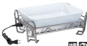
⑤BSウォーマースタンド セット