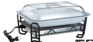
④BSウォーマースタンド セット