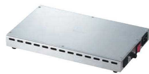
⑭SW電気ビュッフェウォーマー