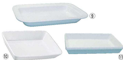
BSウォーマー用 耐熱フードパン(陶器製)