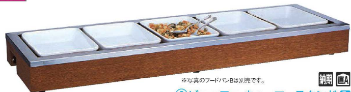
⑧ビュッフェウォーマースタンド