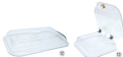
BSウォーマー用 ポリカーボネイトカバー