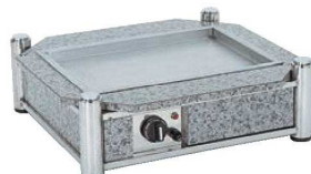
⑥ビュッフェ ウォーマースタンド