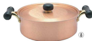
⑧銅IHアンティック浅型鍋 IH-104