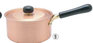
⑨銅IHアンティック片手鍋 IH-101