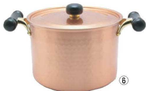
⑥銅IHアンティック深型鍋 IH-103