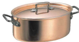
⑤オーバル キャセロール 3520