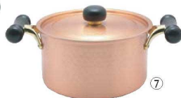
⑦銅IHアンティック両手鍋 IH-102