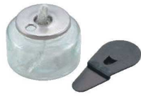
① ヒートエースα スタンダード 6H

③ 専用漏斗を使って燃料を補充します。(補充キャップをお使いいただくで使用です。)