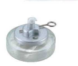
④ ヒートエースα デラックス ロータイプ