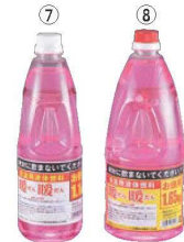
⑦ ⑧ 暖暖 (保温用液体燃料)