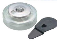
② ヒートエースα スタンダード ロータイプ