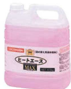
⑥ ヒートエースマックス 詰替専用 液体燃料 4ℓ 71