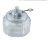
③ ヒートエースα デラックス 6H