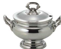
③UK 18-8 菊淵 丸 スープチューリン