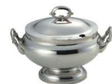
⑤SW 18-8 菊淵 小判 スープチューリン