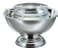
⑬SW 18-8 淵巻 パンチボール