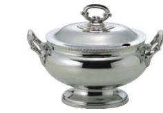
①UK 18-8 菊淵 小判 スープチューリン