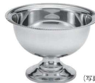
⑩UK 18-8 パンチボール