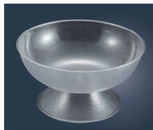
⑨キャンプロ カムウェア パンチボール