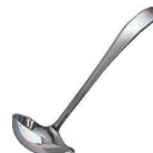
⑯18-8 ニューライラック パンチレードル