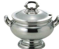
④UK 18-8 B淵 丸 スープチューリン