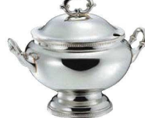
⑦SW 18-8 菊淵 丸 スープチューリン