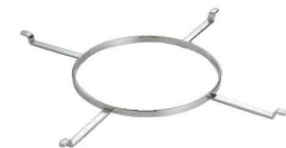
⑭SW 18-8 スパイダーリング