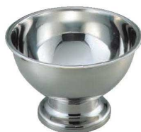
⑫ヴォラース パンチボール