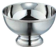
⑮SW 18-8 菊淵 パンチボール ミニ 2.4ℓ