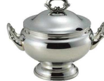
⑧SW 18-8 B淵 丸 スープチューリン