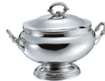
⑥SW 18-8 B淵 小判 スープチューリン