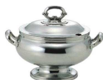
②UK 18-8 B淵 小判 スープチューリン