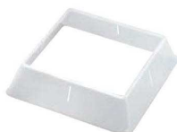
⑧ポリプロピレン 角皿枠