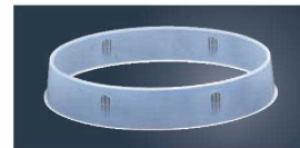
⑦ポリプロピレン 小判皿枠