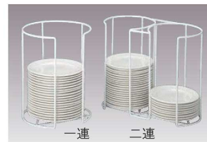
⑫EBM プレートカセットホルダー (18-8ステンレス/ビニールコーティング仕上)

上外寸:138×138 下外寸:180×180 高さ:H60 使用角皿サイズ:平面部分(138mm・180mm角) ※耐熱温度:-20℃~120℃