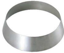
①SW 18-8 丸皿用 皿枠