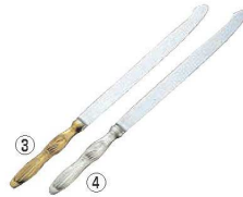
18-8 ウェディングケーキナイフ すずらん