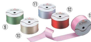
ウェディングリボン