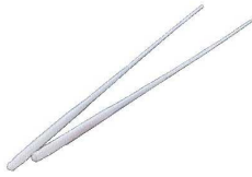
① トーチ用 フラワーテーブルキャンドル