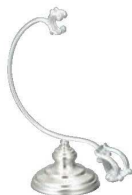
⑧ H洋白ケーキナイフスタンド 三種メッキ