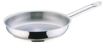
②パデルノ 18-10 フライパン