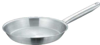
⑤マトファー/ブジャ 18-10 フライパン 6850

*コード下1桁が1の商品はメーカー品番35044になり、取手や形状が変わります。