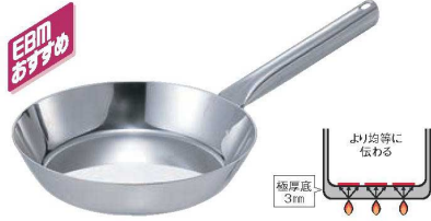
①EBM モリブデンジⅡ フライパン