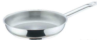
⑥ムヴィエールプロイノックス フライパン 5843

底厚:7.0mm ●熱伝導・熱保温が非常に良い材質(多層構造)を使用しておりますので、料理時間が短縮できます。