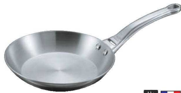
③デバイヤー アフィニティ フライパン 3724