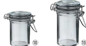
⑯キルナージャー (6個セット) クリア 71