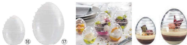
⑩エッグカプセル クリア 71