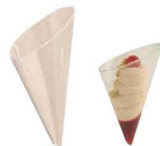
㉑プチョーン 30ml (20入) クリア 71