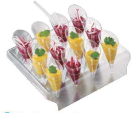
㉓パーティセット (コーン12個用) 71

外寸:489/234×H294 材質:アクリル ※プチョーンは別売です。②プチョーンをご使用ください。