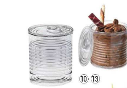
⑫ミニカン 110ml (200入) 71