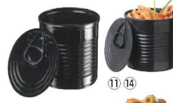
⑬ミニカン 220ml (100入) 71

外寸:φ61×H57 材質:ポリスチレン(シルバーのみアルミコーティング) 耐熱温度:-18~70℃