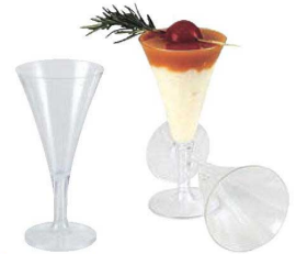
⑥カクテルグラス 70ml (12入) クリア 71