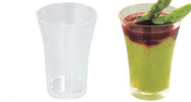
⑤ミニグラス 50ml (12入) クリア 71

外寸:φ44×H60 材質:ポリスチレン(シルバーのみアルミコーティング) 耐熱温度:-18~70℃