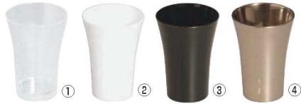
①ミニグラス 50ml (50入) 71