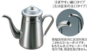
注ぎやすい細口タイプ (左は従来の太口タイプ)

電磁調理器用に底面特殊加工されたコーヒーポットです。もちろん直火やヒーターでも使用でき、熱源を選びません。