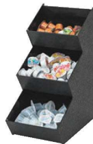
⑬ポーションオーガナイザー 3段 切