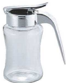
⑮ガラス スリム ハニージャー 切