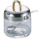
③ガラス シュガーポット No.8005 スキ 切