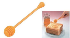
⑲ハチミツスプーン 切