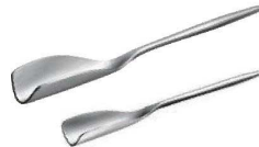
⑭くるりとハチミツスプーン 切