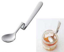
⑰18-8 ハニースプーン 縦型 切