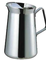
⑦SW 18-8 ET型 ウォーターポット (アイスガード付)