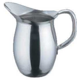
①EBM 18-8 ペリカン ウォーターポット (氷止め無)