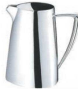
③UK 18-8 トライアングル ウォーターポット