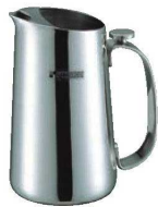
⑤18-8 リッチ ウォーターピッチャー RC-02