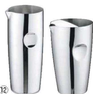
⑫ UK 18-8 ウォーターピッチャー