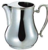
⑥SW 18-8 ビクトリア ウォーターポット (アイスガード付)