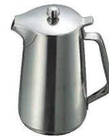
⑩SW 18-8 A型 ウォーターポット