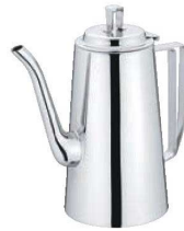
⑥UK 18-8 K型 ウォーターポット