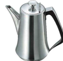
⑬SW 18-8 PC柄 ウォーターポット