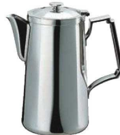
⑫SW 18-8 角 ウォーターポット