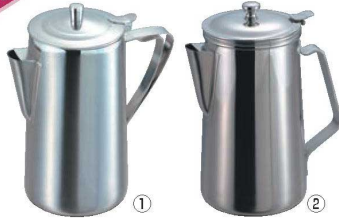
EBM ステンレス ウォーターポット