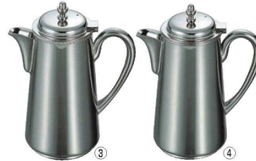
UK 18-8 ウォーターポット 1.8ℓ