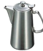
⑦UK 18-8 チボリ ウォーターポット