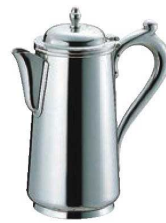
⑨SW 18-8 ウォーターポット B淵