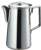
⑪SW 18-8 C型 ウォーターポット