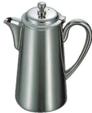
⑤UK 18-8 M型 ウォーターポット