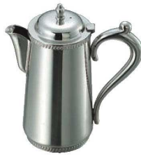
⑧SW 18-8 ウォーターポット 菊淵