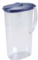
①ベーシックジャグ 71