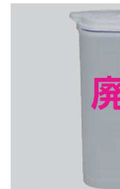
⑤ウォーターピッチャー ドリンク・ビオ 2.7L 77