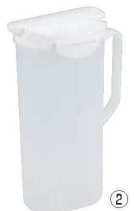
フェローズ ハンディ プッシュ 71