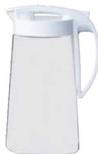
⑫ドリンク・ビオ ホワイト 71