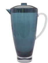
⑨カーライル エピキュール ピッチャー 2.2L EP30 アクア 77