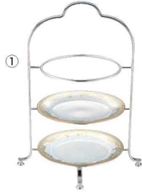
①UK 18-8 3段 ハイティースタンド