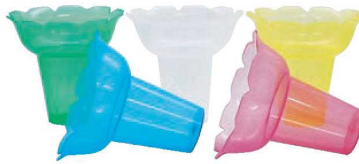
⑪PP フラワー氷カップ 500入 (5色×100)

口径φ86×H83(310cc) 材質:PP-ジーンバルブ100% 内面ポリエチレンラミネート加工 ●かき氷の他にも、からあげ、フライポテトなどにも使えます。 ●青・赤・黄が約30%ずつ入っています。 ※若干数量のバラつきがあります。