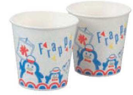
⑨かき氷カップ 紙製 (1,500入) SM-400