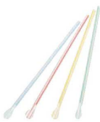
⑱スプーンストロー裸 (500本入)