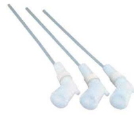
⑧ハンディシャワー 3本組