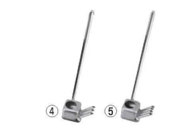
EBM 18-8 ウナギタレカケ