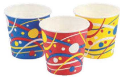
⑩緑日小町カップ (90入) SV-311EN