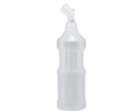
⑦ハンディー みつけ器