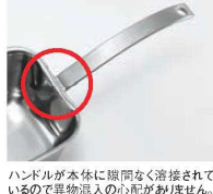
ハンドルが本体に隙間なく溶接されているので異物混入の心配がありません。