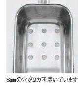
8mmの穴が9カ所開いています。