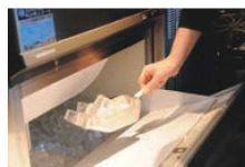
氷だけでなく、粉物にも最適です。