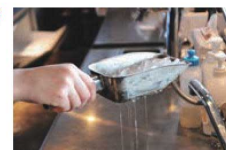
穴のおかげでスムーズに氷が切れ、氷のみを簡単にすくう事が出来ます。