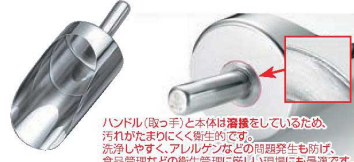
ハンドル(取っ手)と本体は溶接をしているため、汚れがたまりにくく衛生的です。洗浄しやすく、アレルギーなどの問題発生も抑え、食品管理などの衛生管理に優しい環境にも最適です。