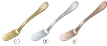
純銅 楕目 アイスクリームスプーン