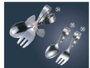
18-8 ハッピーデー ベビーシリーズ

●21-0ステンレス品が無くなり次第(下2ケタ 10コード)18-8ステンレス品に変更になります。