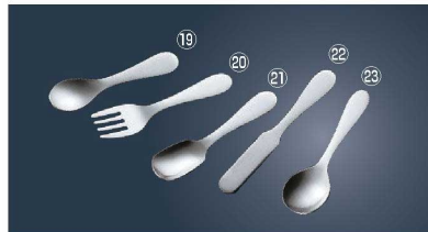
WA 21-0 無地プチシリーズ