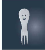
㉝21-0 ニコ パーティーフォーク

●21-0ステンレス品が無くなり次第(下2ケタ 10コード)18-8ステンレス品に変更になります。