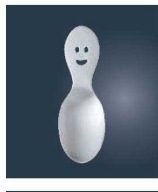
㉜21-0 ニコ ティーサーバー

●21-0ステンレス品が無くなり次第(下2ケタ 10コード)18-8ステンレス品に変更になります。