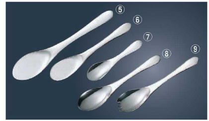
18-8 便利小物シリーズ