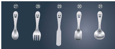
21-0 NICO ニコ